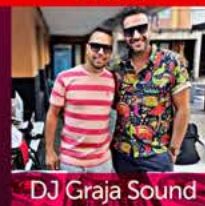
DJ Graja Sound