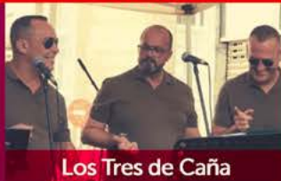
Los Tres de Caña