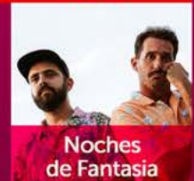
Noches de Fantasia